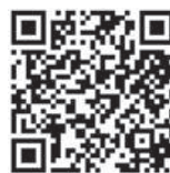
後期高齢者医療制度について(広域連合HP)