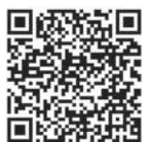
国民健康保険について(町HP)